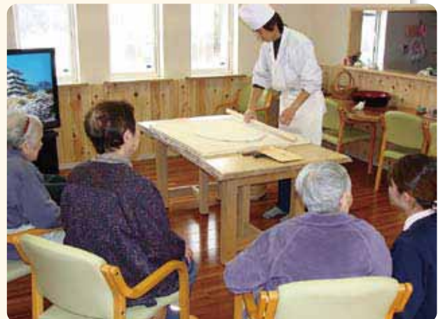
手打ちうどんをスタッフが披露 来場の皆さんも職人の技に感動しました