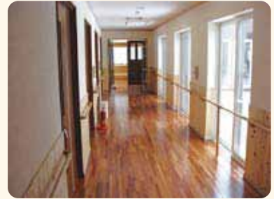
歩行訓練にも使える回遊式廊下