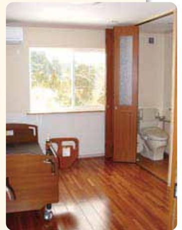
ゆったり過ごせる個室