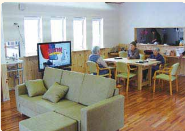
レクリエーション室／食堂