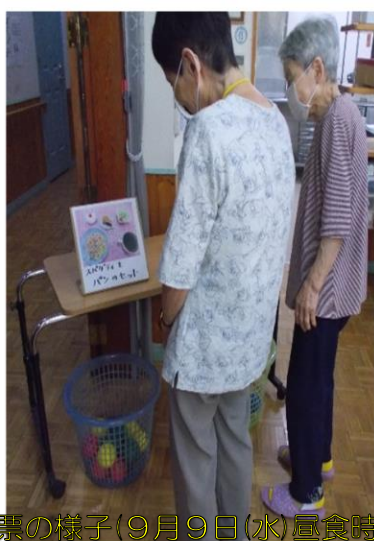
投票の様子(9月9日(水)昼食時)